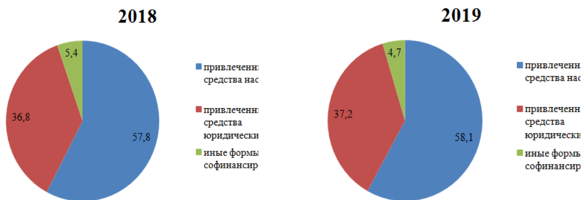
Рисунок 2 – Структура внебюджетных источников финансовой поддержки проектов инициативного бюджетирования в 2018-2019 гг.

Рассчитано авторами на основе данных [2]