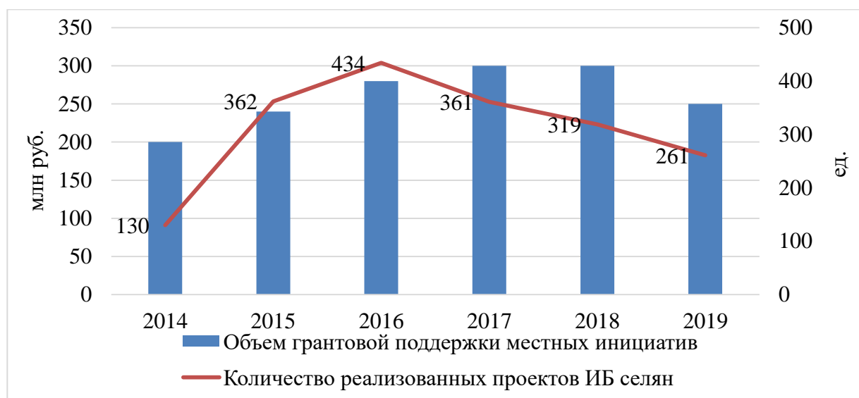
Рисунок 3 – Динамика количества и объемов финансирования реализованных местных инициатив граждан, проживающих в сельской местности, получивших грантовую поддержку в РФ*

По данным Минсельхоза РФ, на грантовую поддержку местных инициатив ежегодно выделяется свыше 200 млн руб. (рисунок 3), что явно недостаточно для развития партисипаторного бюджетирования и существенного улучшения качества жизни на селе.